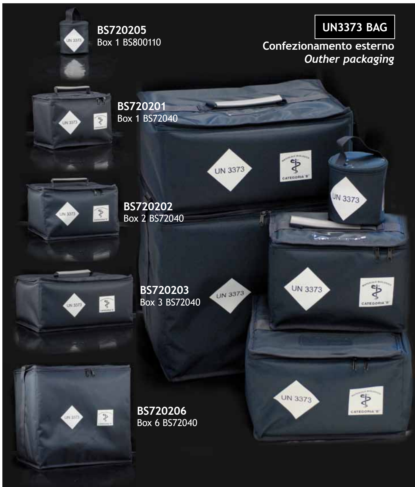
BS720205 Box 1 BS800110

System for protection and transport of biological samples by safety containers, in accordance with ADR European norms