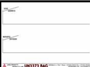
BS720206 Box 6 BS72040